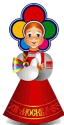
СП ГБОУ СОШ №4 г.о Чапаевск-детский сад №1