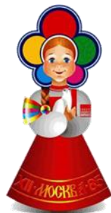
СП ГБОУ СОШ №4 г.о Чапаевск-детский сад №1