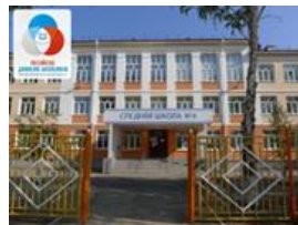
ГБОУ СОШ №4 г.о. Чапаевск