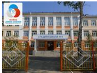
ГБОУ СОШ №4 г.о. Чапаевск

Цель проекта: создание системы деятельности, направленной на формирование учебной мотивации и повышение уровня обученности школьников.