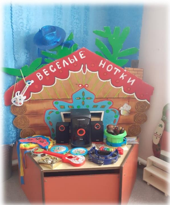
1 детский сад (представлены 2 фотографии)