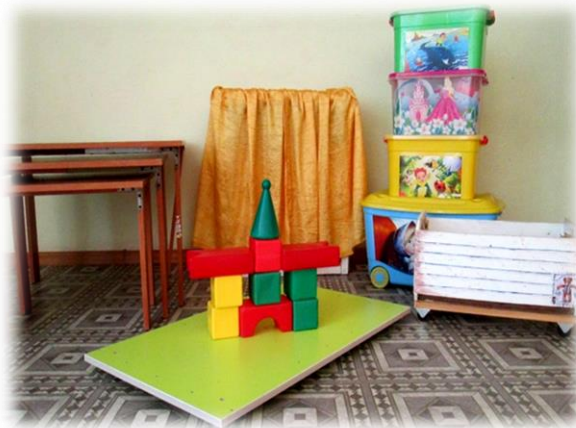
Мебель трансформируемая и полифункциональная