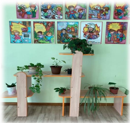
1 детский сад (представлены 3 фотографии)