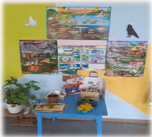
1 детский сад (представлены 3 фотографии)