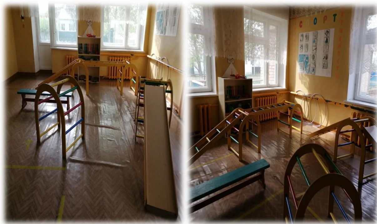
1 детский сад (представлены 2 фотографии)