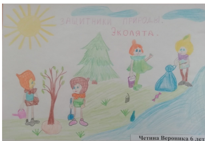
Четина Вероника 6 лет