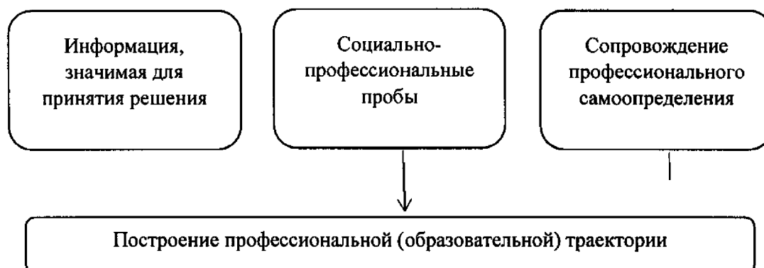
Рис. 1. Элементы профессиональной ориентации, обеспечивающие построение субъектом профессионального самоопределения профессиональной (образовательной) траектории

доступа субъектов профессионального самоопределения к качественному и разнообразному содержанию элементов профессиональной ориентации (см. рис. 1).