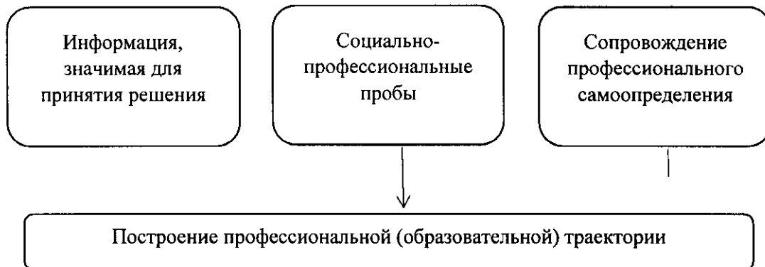
Рис. 1. Элементы профессиональной ориентации, обеспечивающие построение субъектом профессионального самоопределения профессиональной (образовательной) траектории

доступа субъектов профессионального самоопределения к качественному и разнообразному содержанию элементов профессиональной ориентации (см. рис. 1).